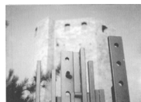
RIPE – CITTÀ D'ARTE CONTEMPORANEA