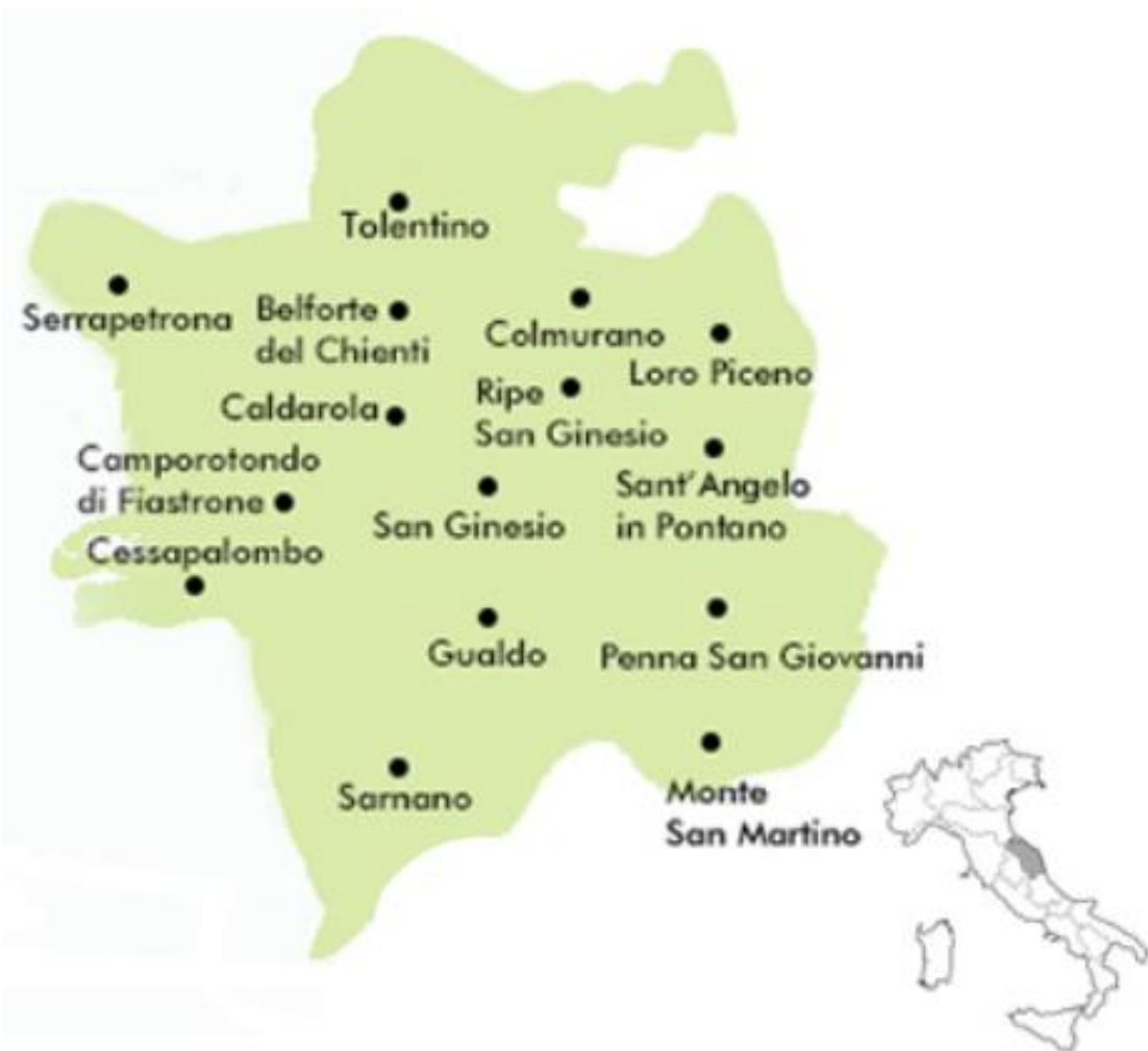
STRUTTURA DEMOGRAFICA - al 1.1.2020